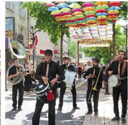
Sous les parapluies fantaisies, la fanfare « Jazz Combo Box » a démontré aux spectateurs qu'un DJ pouvait également déambuler dans les rues.