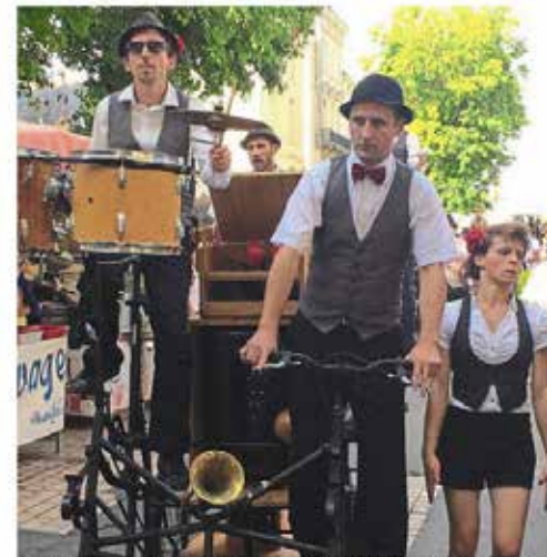
De la danse, du jonglage et des échasses en jouant de la musique : c'est le parti relevé par la troupe « Swing'o pattes » en déambulant dans les rues de Saumur.

Le festival se poursuit aujourd'hui (voir les sorties page suivante).