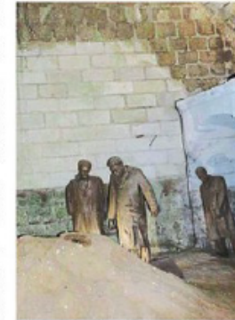
Étonnants souterrains !

Pour des raisons de sécurité, la visite du château et de ses souterrains n'est malheureusement pas accessible aux personnes à mobilité réduite, à l'inverse de la séance de cinéma.