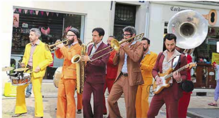
Saumur, place du marché, hier. Costumes vintage, petits pas de danse, la fanfare « Les Trains Savates » a fait danser le marché hier matin. Touristes et Saumurois n'ont pu s'empêcher de s'arrêter quelques instants les regarder se déhancher au son de leur musique funk qui réunit petits et grands.

Sur le marché, en déambulation dans les rues ou en concert, les différents groupes présents à la deuxième édition du week'n jazz font danser le centre-ville au son de leurs instruments.