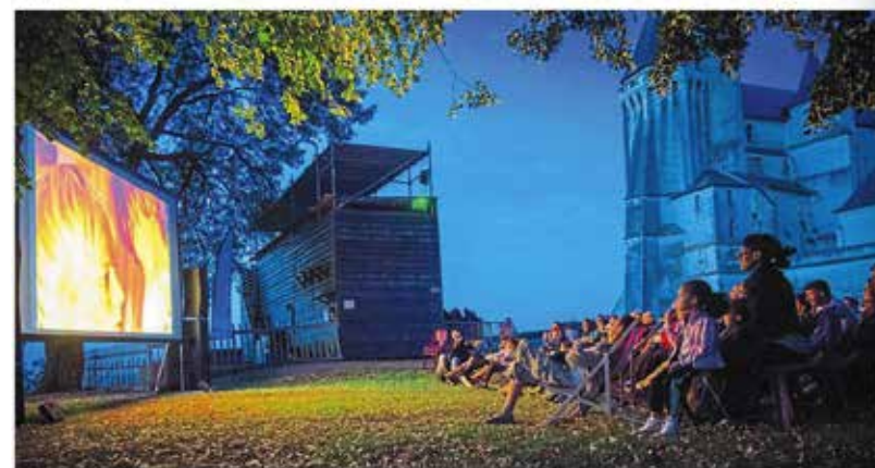
Installés dans des chaises longues, Saumurois et touristes attendent avec impatience 22 heures que la séance commence.

Avec une vue à couper le souffle sur la ville de Saumur, la troisième édition des séances de cinéma en plein air est désormais bien lancée. Tous les lundis, le château accueille une nouvelle projection.