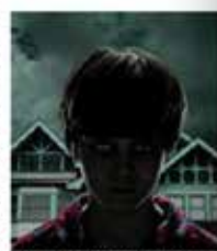
Scène ouverte le 14 août au château.

Programme complet sur le site Internet de la Ville : http://www.saumurville-saumur.fr/