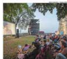
Tout au long de l'été, après un repas léger et une dégustation sur arbutus, le château ouvre ses portes au cinéma (à l'été prochain).