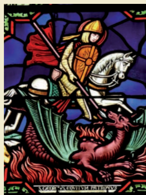
Saint Georges, vitrail du chœur