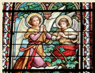
Vitrail, collatéral nord

- Saint Maurice, patron des fantassins, par Lobin (1890)