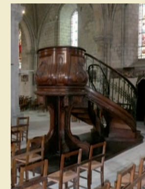
La chaire du 18 e siècle