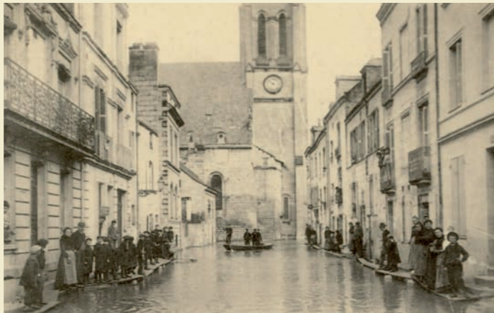
La rue Courcouronne pendant les inondations de 1904

Située dans un quartier inondable, l'église est régulièrement victime des crues du fleuve : les inondations de 1496 et de 1615 notamment ont entraîné le rehaussement progressif du sol, affectant les proportions originelles de l'édifice. Déjà au 15 e siècle les voûtes des bas-côtés avaient été reconstruites. En 1711 le clocher fut renversé par un ouragan. En 1769, le nouveau pont est ouvert ; le bac qui permettait de traverser la Loire en vis-à-vis de l'église est supprimé. Cette évolution importante de la circulation en ville va entraîner une inversion de l'orientation de l'édifice, dont on va tourner la façade principale vers le nouvel axe majeur de la ville. Par conséquent des portails sont percés dans l'abside et les