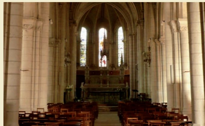
Intérieur de l'église

au dernier tiers du 12 e siècle. L'église présentait à cette époque l'aspect d'une église-halle, à trois vaisseaux d'égale hauteur. Saint-Nicolas paraît avoir reproduit le parti de la cathédrale de Poitiers, et devait constituer un des monuments gothiques les plus originaux de Saumur. La largeur des travées diminue d'ouest en est, accentuant ainsi l'effet de profondeur (ce même procédé est utilisé aussi au Puy-Notre-Dame, autre église influencée par les dispositions de la cathédrale de Poitiers). Les trois vaisseaux se terminaient vers l'est chacun par une abside, celle du vaisseau principal étant plus profonde et plus large que les deux autres. Les absidioles des collatéraux subsistent mais le chœur gothique a fait place au clocher au 19 e siècle. En avant du chœur primitif, de fortes piles à 16 colonnettes semblent indiquer l'emplacement du clocher gothique.