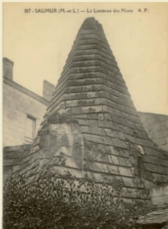
Ancienne lanterne des morts au début du 20 e siècle

L'église Saint-Nicolas est citée pour la première fois dans une bulle du pape Eugène III en 1146. Son appellation à cette époque est Saint-Nicolas-de-la-Rive ou Saint-Nicolas-des-Rives, puisque l'église est édifiée au bord de la Loire. Par la suite, l'église portera le vocable de Saint-Nicolas des Bilanges ou du Chardonnet. L'église Saint-Nicolas est, jusqu'à la fin de l'ancien régime, une succursale de la paroisse de Notre-Dame de Nantilly. Saint Nicolas est le patron des mariners et des marchands : sa présence dans le quartier n'est donc pas étonnante. Le faubourg Saint-Nicolas est traditionnellement considéré comme un quartier de négoce. Les mariners pouvaient accoster au port Saint-Nicolas situé le long de l'église. Un pèlerinage à saint Nicolas est encore signalé