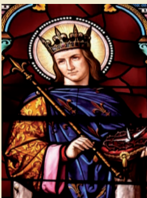
Saint Louis, vitrail du chœur