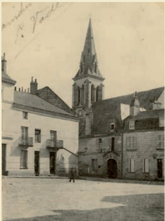
L'Église vue depuis l'ancien port Saint-Nicolas au début du 20 e siècle (Archives Municipales Saumur)