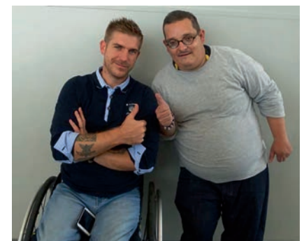
Interview réalisée par Cédric BURGEVIN

Enfin, je vais participer à des interventions de sécurité routière avec la mairie de Saumur, les écoles, les collèges, les lycées ou encore les entreprises.