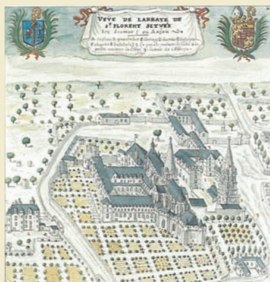
L'abbaye de Saint-Florent au XVII e siècle (dessin de Delusse, Musée de la Marine de Loire)

par Antoine Meunier, professeur d'histoire