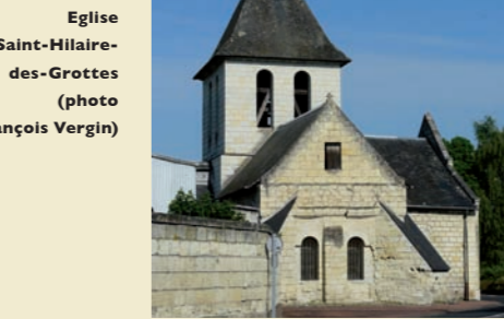
Eglise de Saint-Hilaire-des-Grottes

Dans un premier temps nous visiterons la réserve : seront évoquées l'histoire de la constitution du fonds et les techniques de classement. Ensuite nous pourrions découvrir quelques ouvrages du fonds ancien, issus notamment de la bibliothèque de l'ancienne abbaye de Saint-Florent, et du fonds de l'académie protestante (dont certains ouvrages de la bibliothèque personnelle de Duplessis-Mornay).