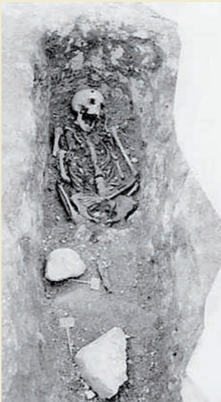
Sépulture carolingienne découverte sur le site des Murailles à Distré

Par ailleurs, l'Office de Tourisme propose une programmation de visites patrimoniales dans le grand Saumurois : Les lundis du patrimoine.