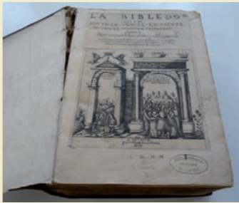
Bible imprimée à Saumur en 1614

La médiathèque de Saumur est un service géré par la Communauté d'agglomération. Elle possède un fonds patrimonial de première importance.