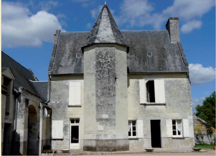
Manoir des Grandes Enverries à Saint-Lambert-des-Levées