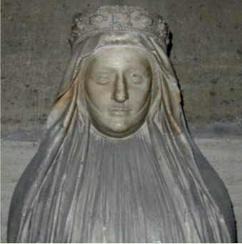
Gisant de Marie d'Anjou, dans la basilique de Saint-Denis

Sœur aînée de René d'Anjou, Marie épouse Charles VII en 1422. Celui-ci, élevé à la cour de Yolande d'Aragon, connaissait bien sa jeune