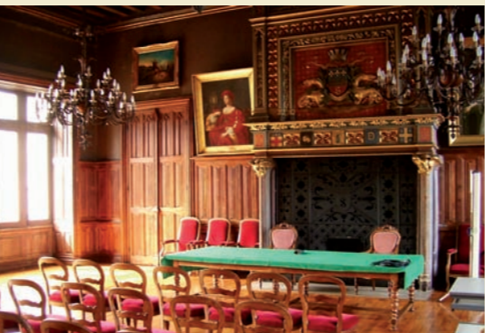
Hôtel de ville, salle des mariages

Cette pause-patrimoine permettra aussi d'évoquer